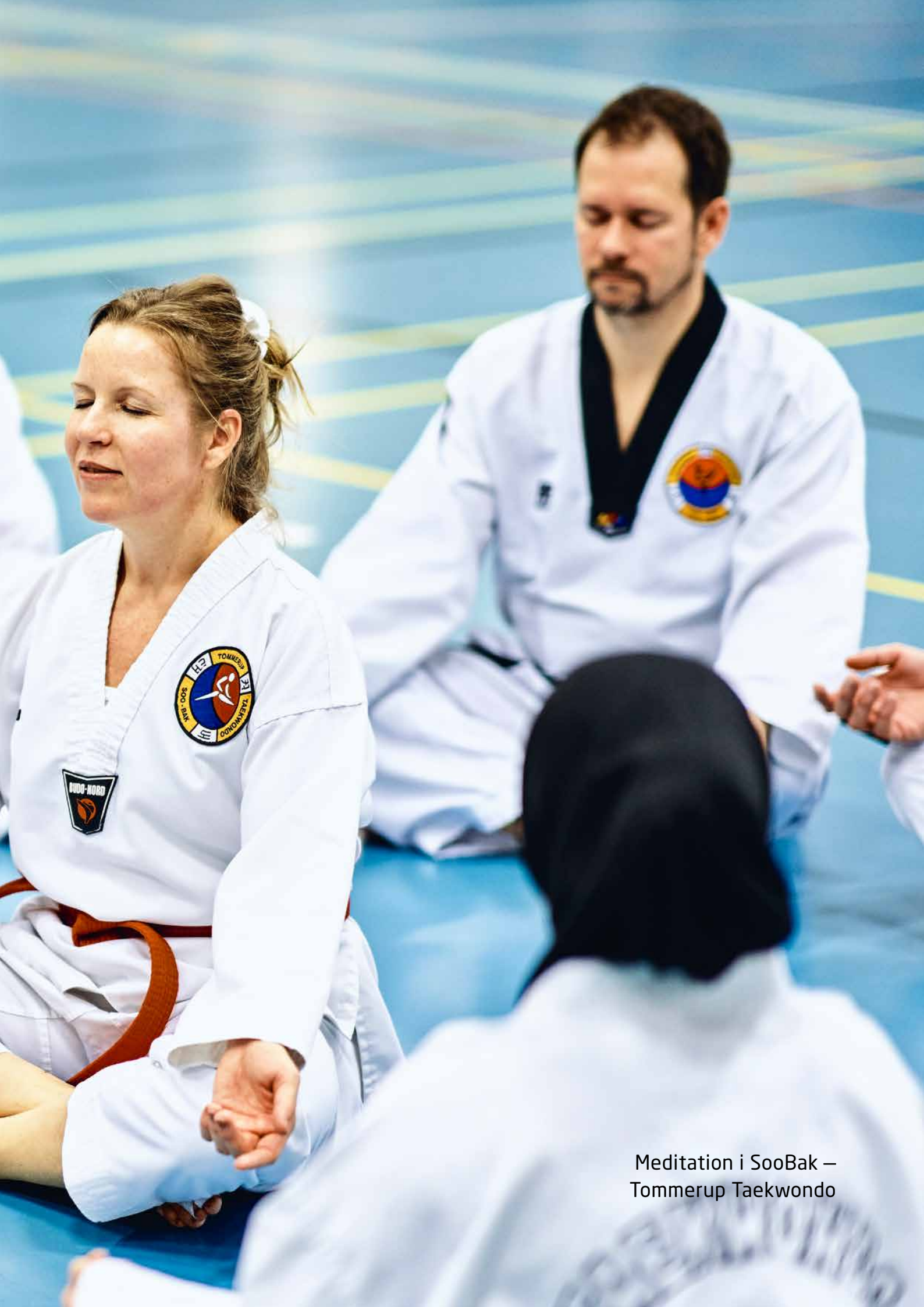
Meditation i SooBak – Tommerup Taekwondo