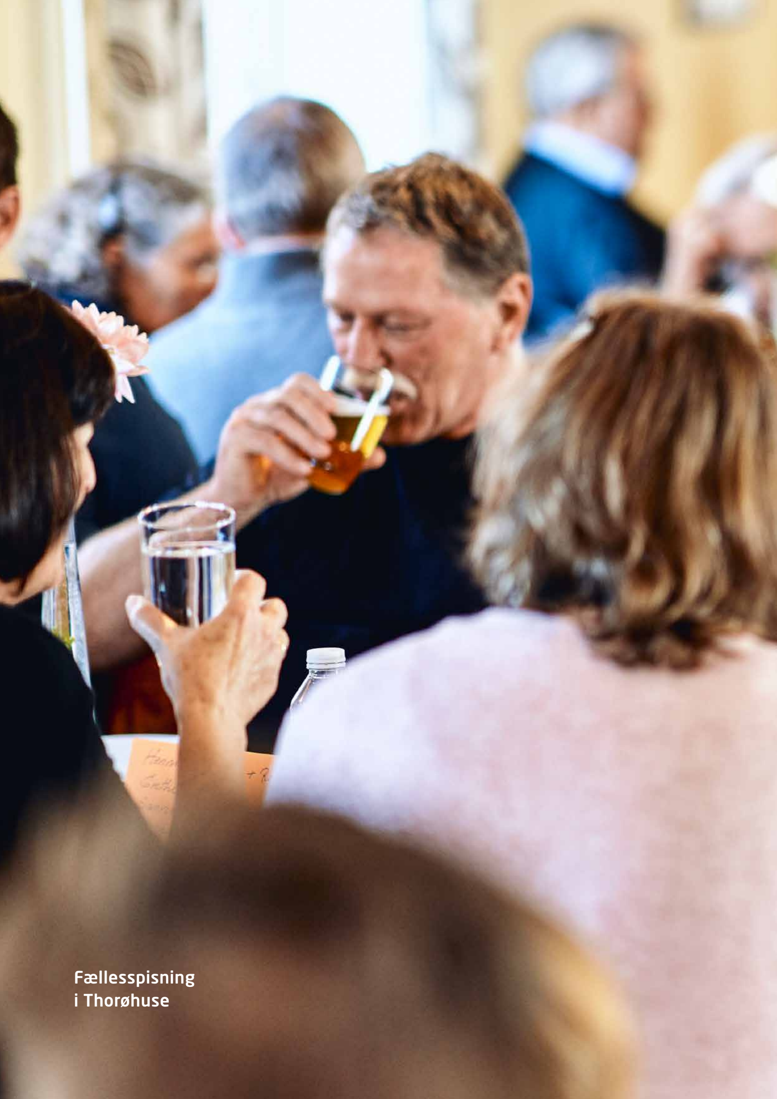
Fællesspisning i Thorøhuse