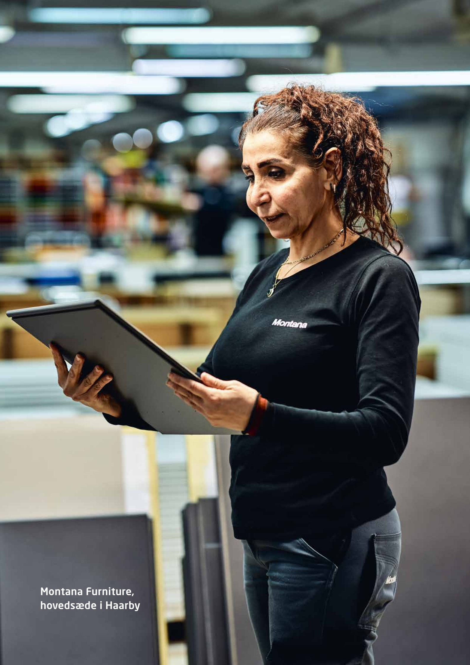
Montana Furniture, hovedsæde i Haarby