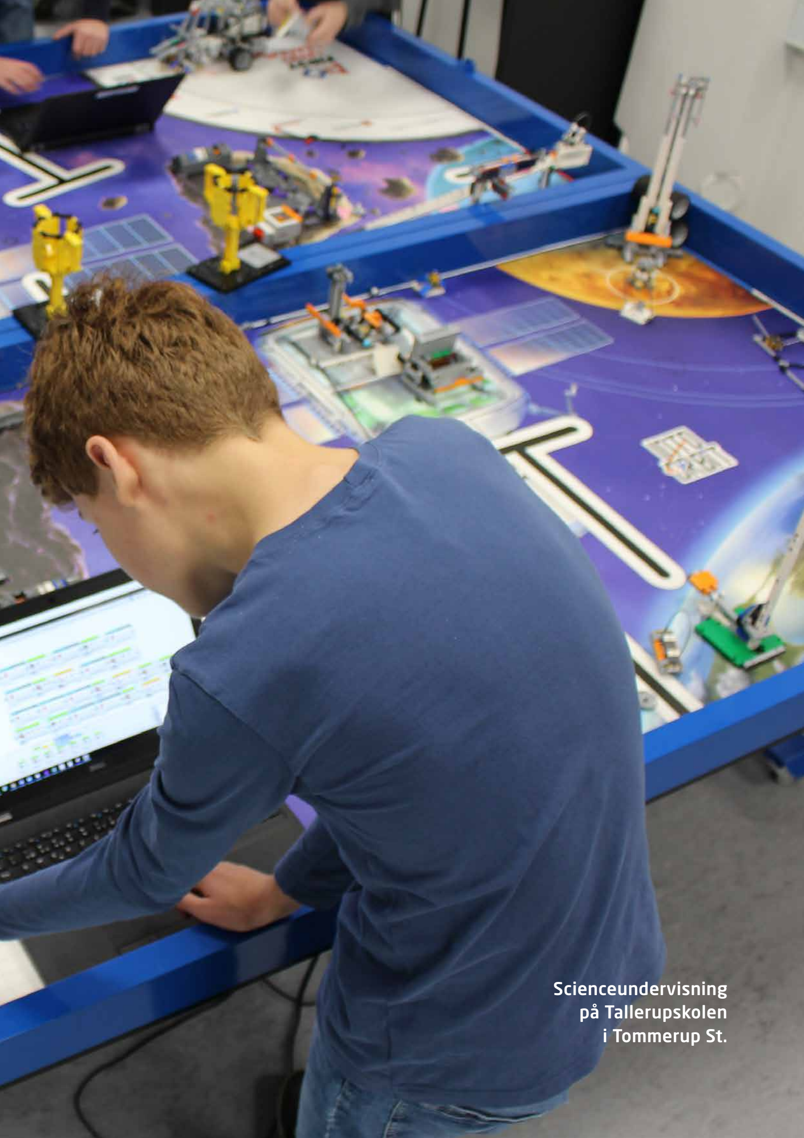
Scienceundervisning på Tallerupskolen i Tommerup St.